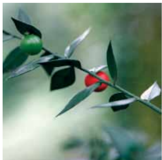
A gilbardeira ( Ruscus aculeatus ) é um dos arbustos mais comuns sob as árvores do parque, possuindo ramos rígidos com vistosas bagas vermelhas.

This walking tour through the park of the Pousada de Santa Marinha is an invitation to discover its plant diversity. Throughout the park, the visitor may find signs on 12 different tree species, whose identification and description are presented here. A set of other species is marked on the itinerary map and can be easily recognized in the park. In every season, the visitor is called to explore the park in a renewed way, and to enjoy its tranquility.