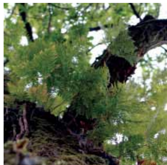
Suspensão no tronco e nos ramos de carvalhos-alvarinhos, o feto-dos-carvalhos ( Davallia canariensis ) é um dos mais curiosos fetos silvestres do parque.

Butcher's-broom ( Ruscus aculeatus ) is one of the most common bushes under the park trees, recognizable by its stiff leaf-like branches, bearing red berries.